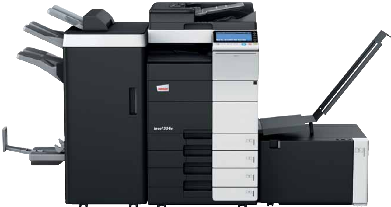
ineo+ 554e mit Heftfinisher (FS-535), Broschürenmodul (SD-512), Job Separator (JS-602), Papierkassette (PC-210), Großraumkassette (LU-204) und Bannertray (BT-C1e)