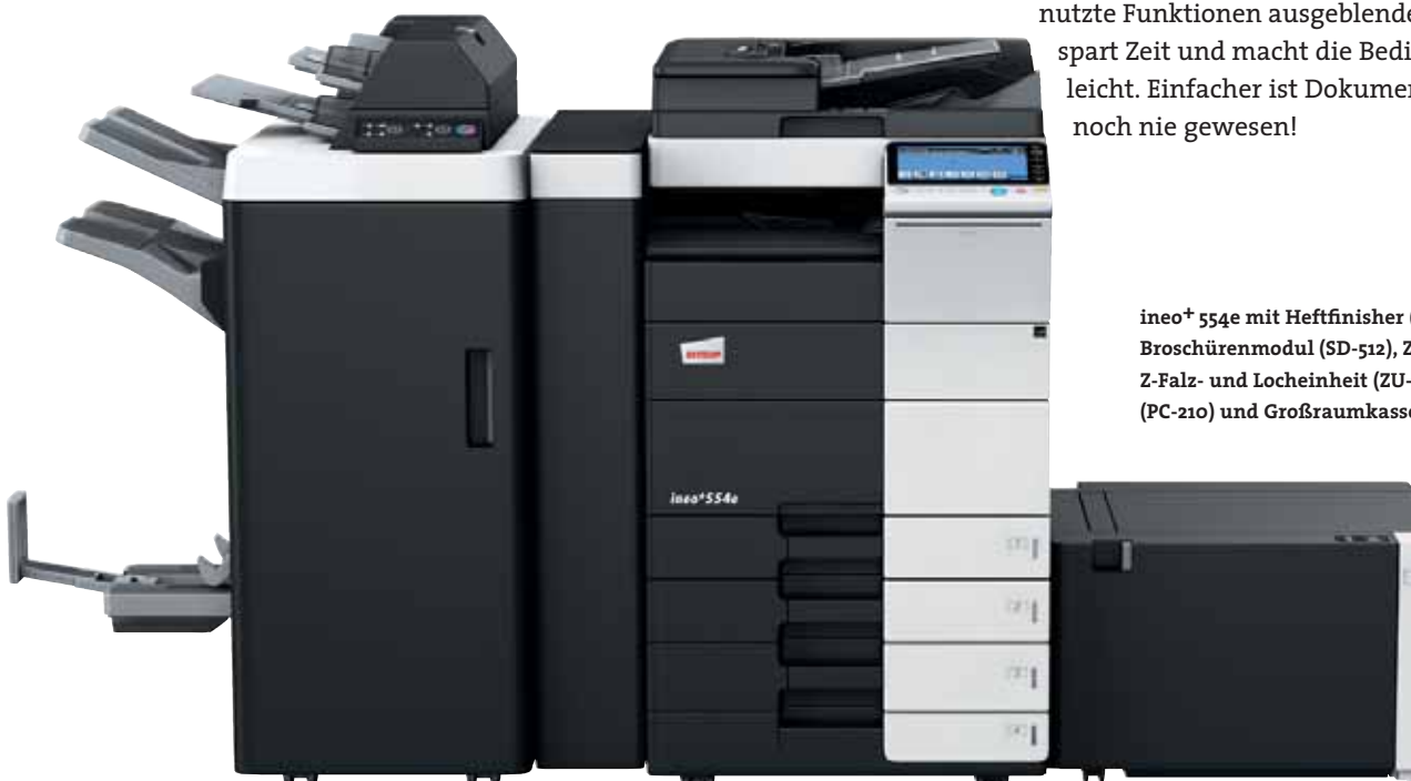
ineo + 554e mit Heftfinisher (FS-535), Broschürenmodul (SD-512), Zuschießeinheit (PI-505), Z-Falz- und Locheinheit (ZU-606), Papierkassette (PC-210) und Großraumkassette (LU-204)

Viele Multifunktionssysteme sind alles andere als anwenderfreundlich. Doch damit ist nun Schluss – die ineo + 554e ist für Ihre Anforderungen wie geschaffen. Das Bedienungskonzept ist intuitiv erfassbar und genauso leicht verständlich wie das eines Smartphones oder Tablet-PCs. Der kapazitive 9 Zoll-Touchscreen verfügt über vertraute Funktionen wie flick, drag&drop und pinch in&out, sodass die Bedienbarkeit ganz einfach ist. Und dank der neuen Menüstruktur lassen sich alle Funktionen auf einen Blick erfassen und die gewünschten Einstellungen mit nur wenigen Berührungen vornehmen. Ein weiterer Vorteil: Regelmäßig genutzte Funktionen können auf dem Startbildschirm abgelegt, ungenutzte Funktionen ausgeblendet werden. Das spart Zeit und macht die Bedienung kinderleicht. Einfacher ist Dokumentenproduktion noch nie gewesen!